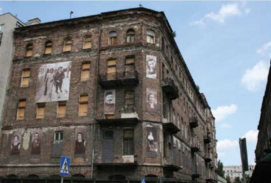
Varsovia (2008). Dos edificios del antiguo gueto de la ciudad preservados como "sitios de memoria".

• Los lugares están cargados de historia y de memoria. Nuestra mirada sobre esos lugares está condicionada por la información que tenemos acerca de lo que vemos. Para analizar esta imagen les proponemos trabajar en dos planos, cómo está el lugar en la actualidad y qué muestran las fotografías que están sobre los edificios y que recuerdan el pasado. En una primera aproximación podemos preguntarle a los estudiantes dónde y cuándo creen que fue tomada esta fotografía para después reponer la información sobre la misma. A partir de esto se puede abrir la reflexión en relación a qué se recuerda y cómo se recuerda: ¿Por qué están esas fotografías allí? ¿Qué se quiere recordar?