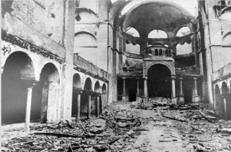
Sinagoga destruida "La noche de los cristales"