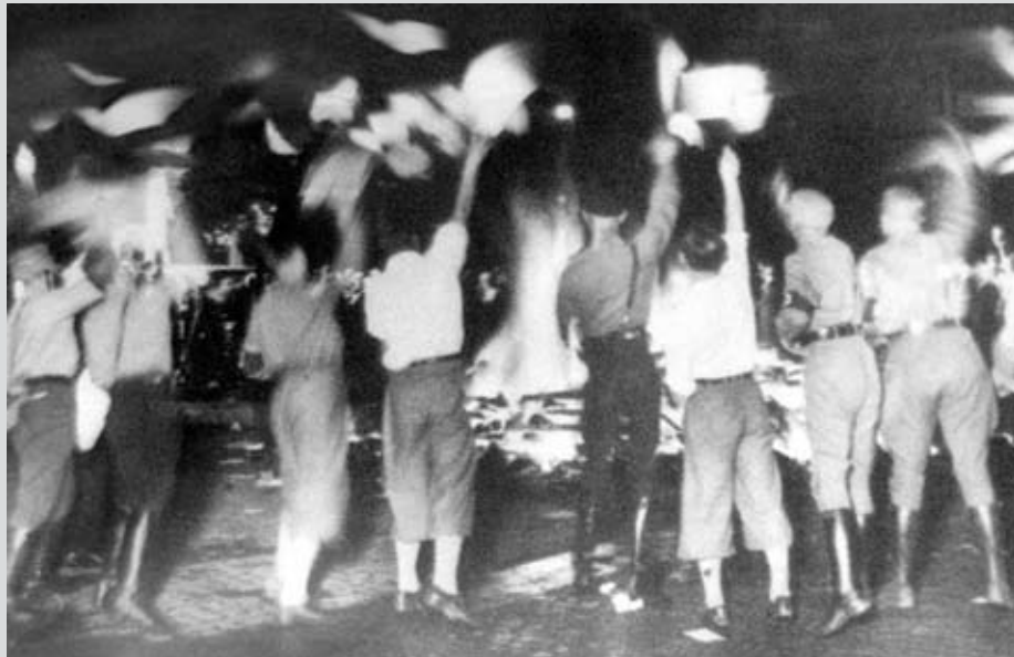
Quema pública de libros prohibidos por los nazis

Testimonio de Shimón Banai, en Toker, Eliahu y Weinstein, Ana (1999), Seis millones de veces uno, Buenos Aires, Ministerio del Interior de la Nación.